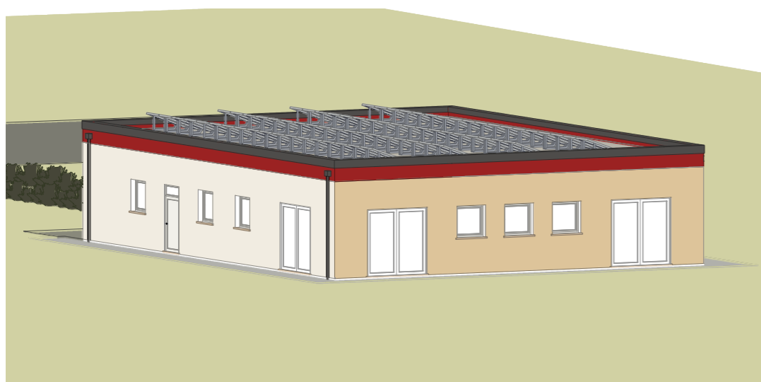
VISTA ASSONOMETRICA NORD-OVEST