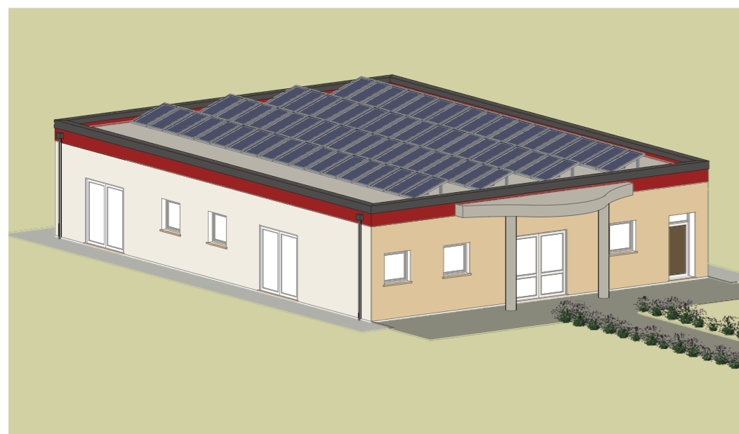
VISTA ASSONOMETRICA SUD-EST