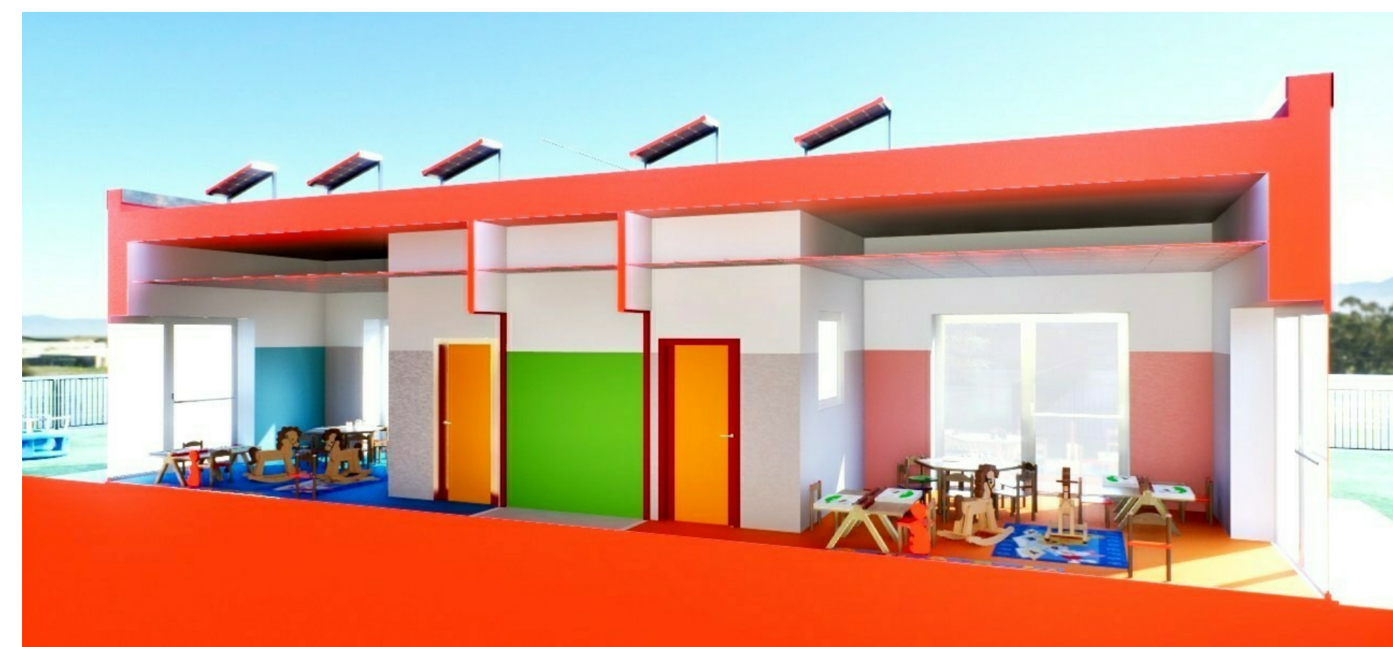
SPACCATO - SEZIONE B-B'