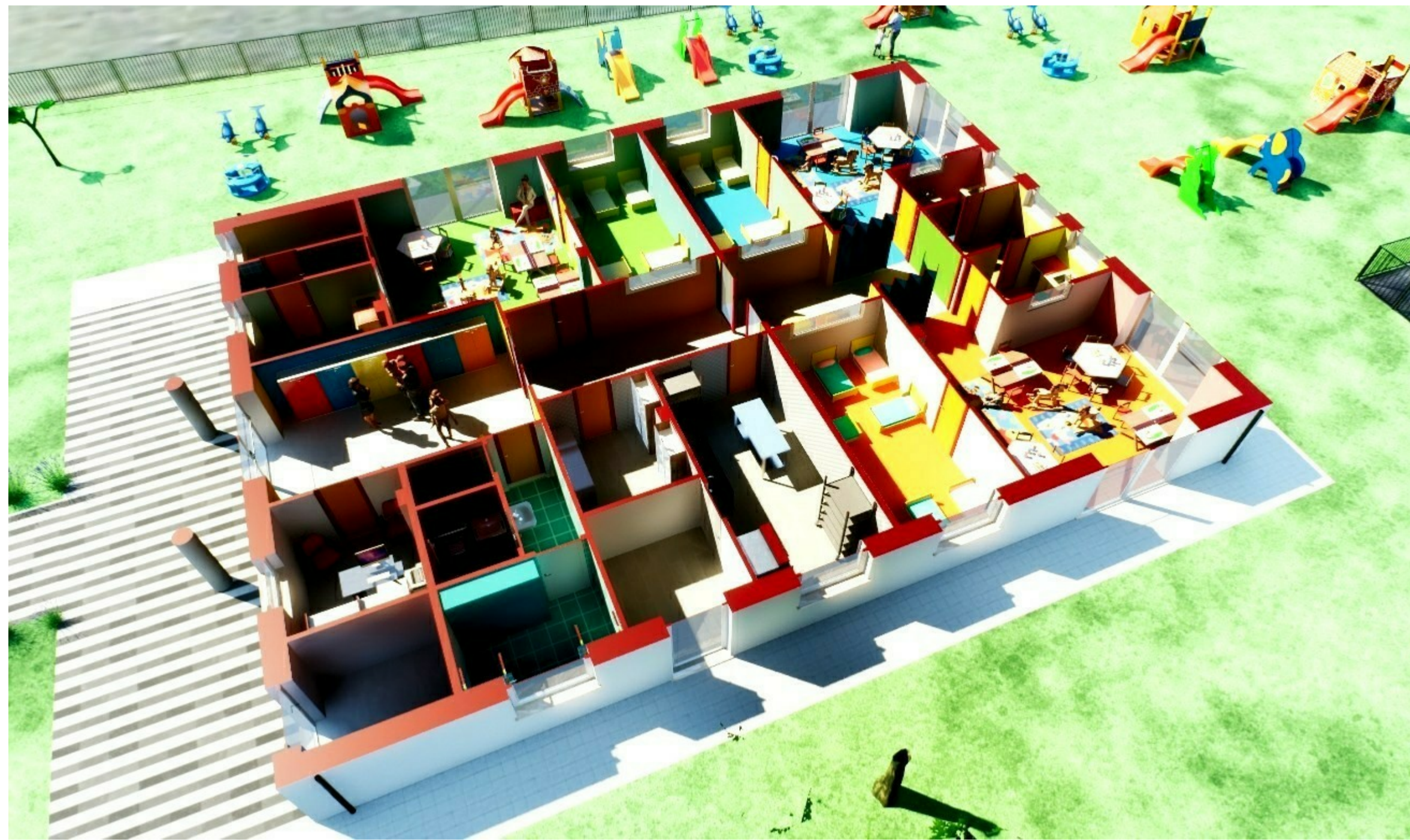
SPACCATO - PIANTA PIANO TERRA