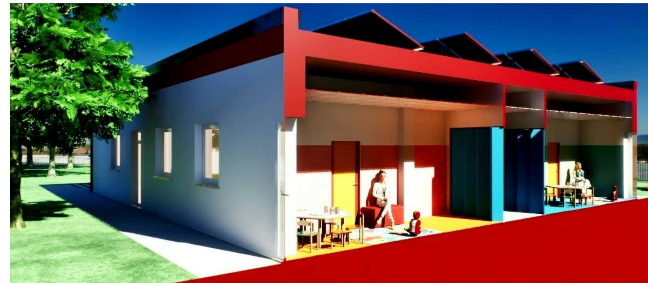
SPACCATO - SEZIONE B-B