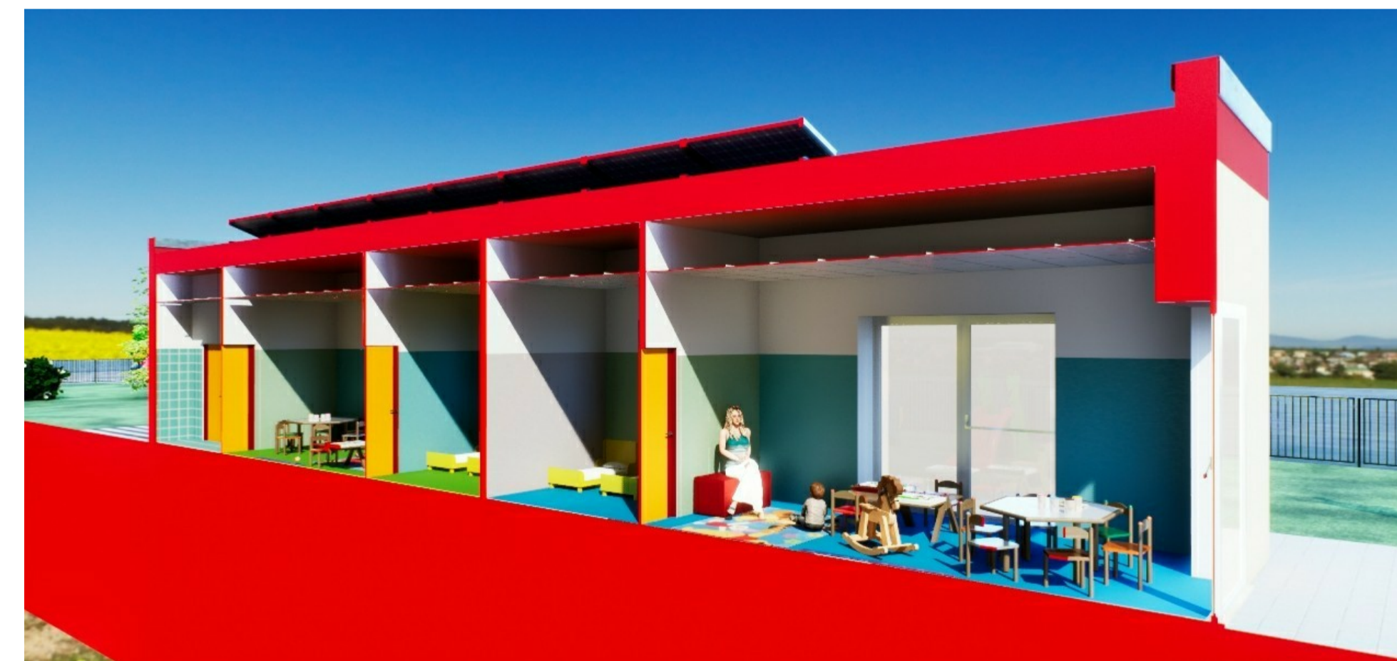
SPACCATO - SEZIONE A-A'