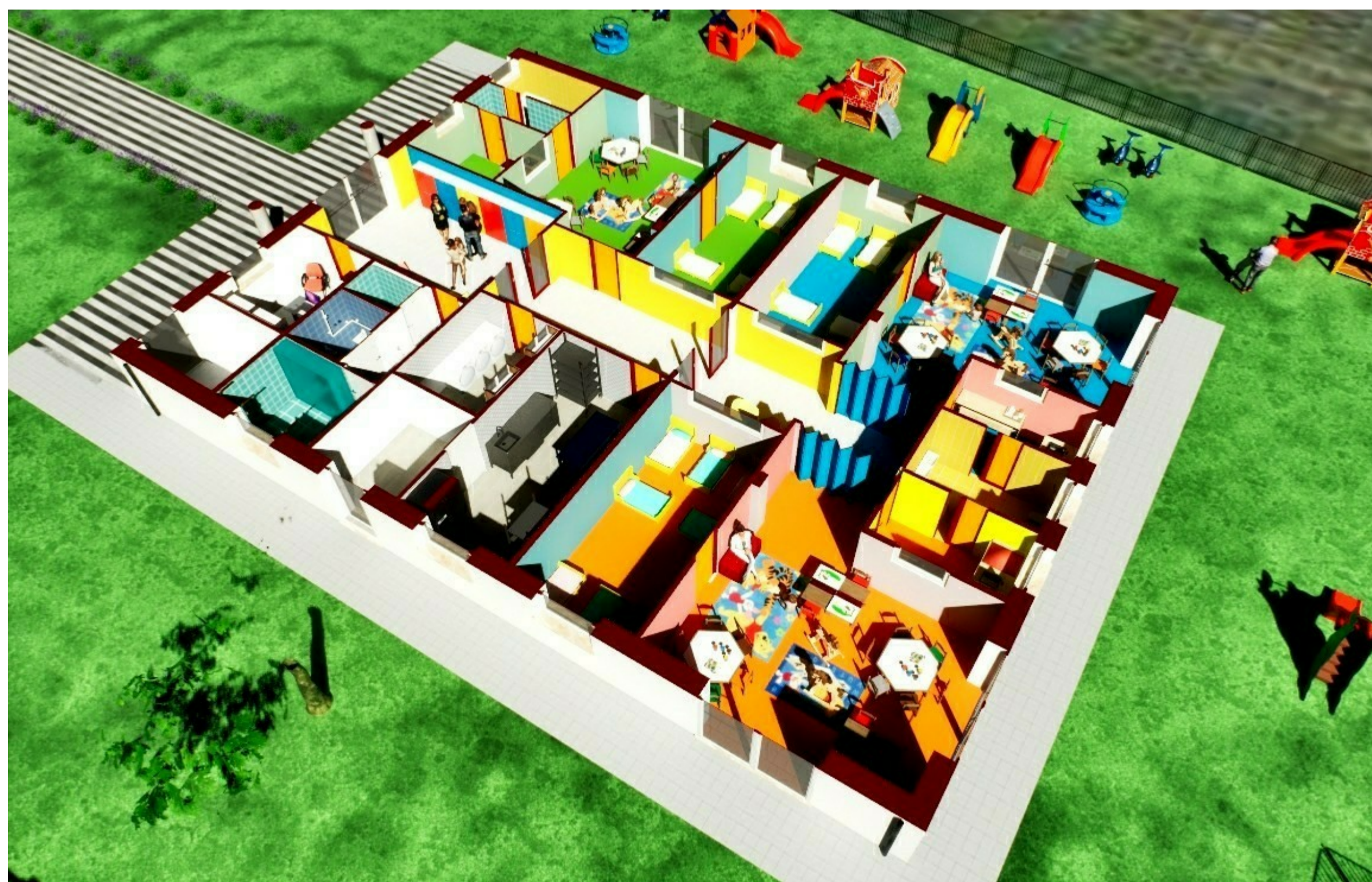
SPACCATO - PIANTA PIANO TERRA