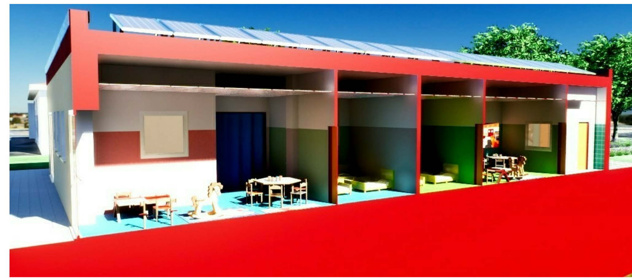
SPACCATO - SEZIONE A-A